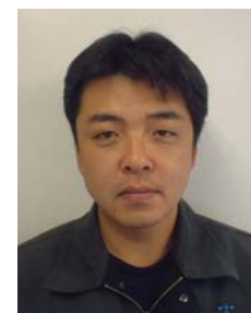
現場代理人: 堀内隆浩

施工: 大協建設株式会社 【現場事務所】 0265-39-1115 【本社】 0265-39-2226 E-mail taikyoht@osk.janis.or.jp