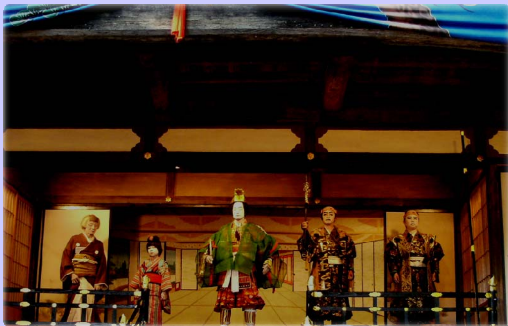
奥州安達原の袖萩祭文の段の一幕

『大鹿歌舞伎』秋の定期公演が18日、市場神社で開催され県内外から二千人の観客が訪れ大変なにぎわいでした。