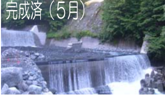
損傷の激しかった水通し部を、衝撃に強い ゴム素材 で補強しました