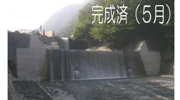
水通し部をゴムで補強するとともに、堰堤の前面にコンクリートを打ち増し安定性を高めました