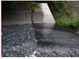
黒色の部分がゴム素材です。廃タイヤを加工した製品で、環境にもやさしいものを用いました