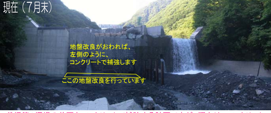
地盤改良がおわれば、左側のように、コンクリートで補強します この地盤改良を行っています