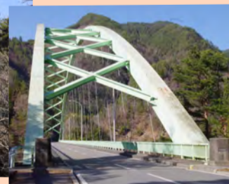
アーチ部材と橋桁は斜めにケーブルで結ばれています