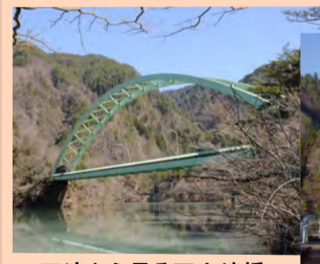
下流から見る羽衣崎橋