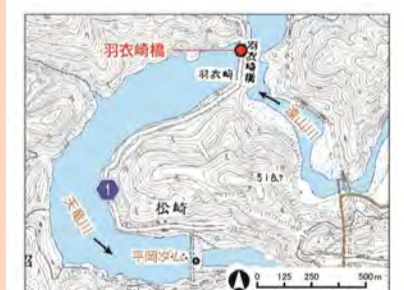
(国土地理院の数値地図25000(地図画像)を使用)