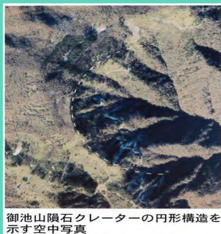
御池山隕石クレーターの円形構造を示す空中写真