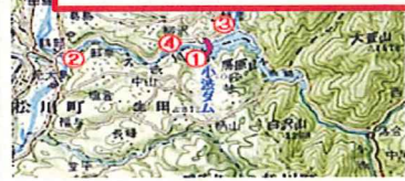
ライブカメラ配置図を拡大表示