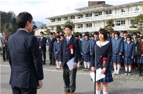
昨年度の開始式の様子