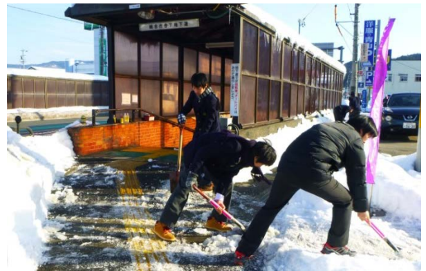
「歩道の雪またじ運動」の様子

飛騨高山高等学校の生徒の方々には、この取組をとおして積極的に歩道除雪を行っていただくとともに、スコップや施設の異状発見時の報告、活動の感想などを寄せていただいております。