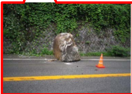
平成25年7月7日落石事故発生