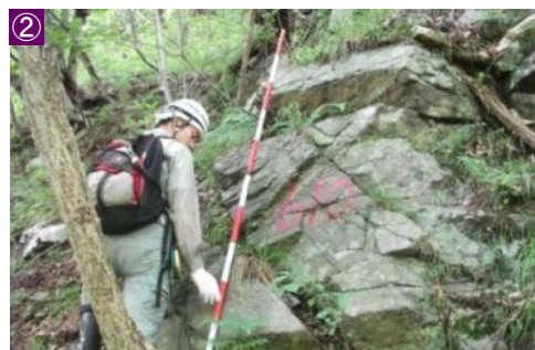
転石・浮石等危険箇所の状況