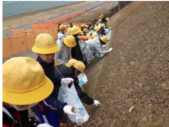
※上記写真はイメージです。