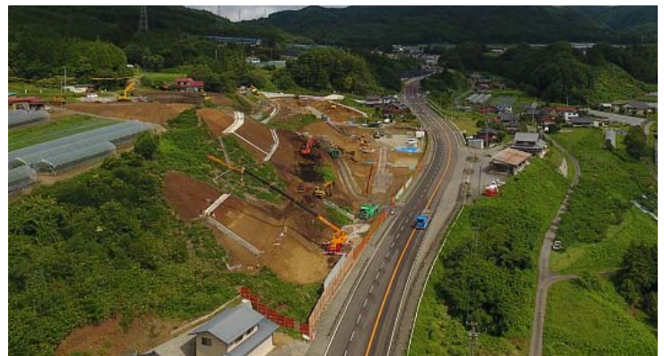
久々野側 切土工事現場