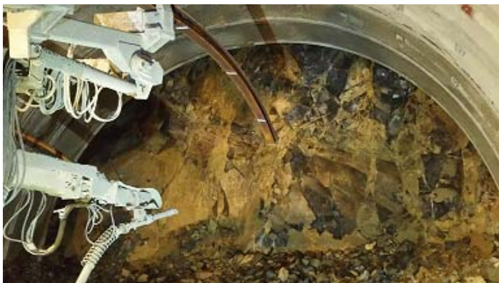
宮峠トンネル工事現場