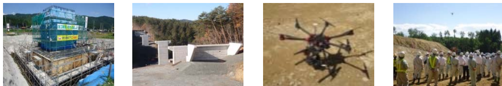
※上記写真はイメージです。