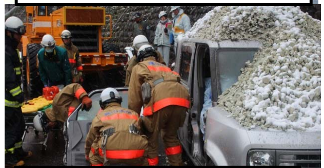
雪崩で埋没した車両からの人命救助