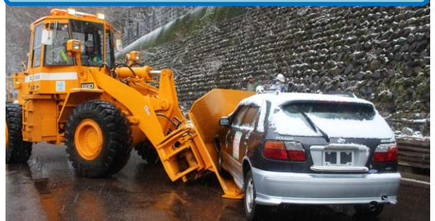
スノーローダーを用いた車両の移動