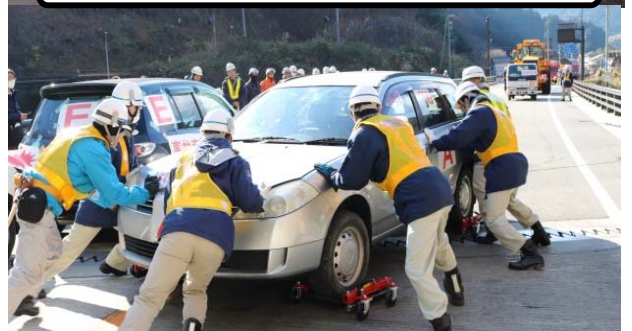
ゴージャッキを用いた車両の手押し