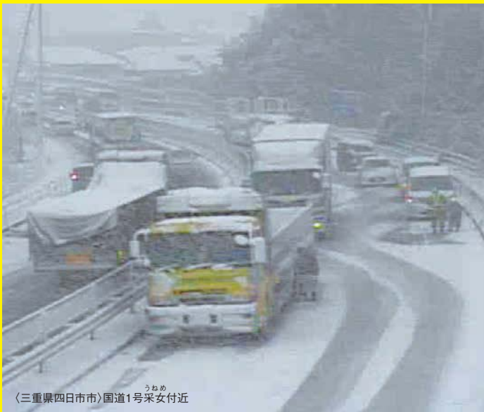
うねめ 〈三重県四日市市〉国道1号采女付近

大型自動車等 7千円 普通自動車等 6千円 都道府県道路交通法施行細則または道路交通規則にて積雪または凍結した路面での冬用タイヤの装着等いわゆる防滑措置の義務が規定されています。(沖縄県を除く) 違反行為は、反則金の適用となります。(大型7千円、普通6千円、自動二輪6千円、原付車5千円)