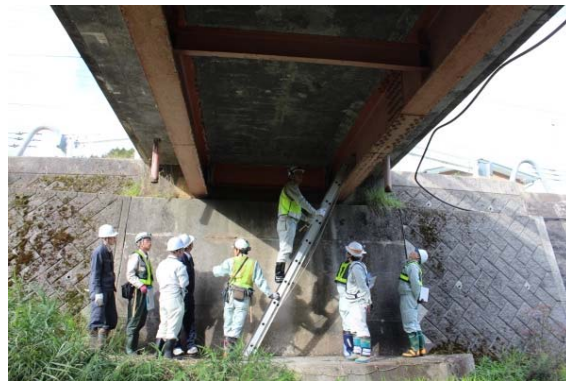
平成27年度橋梁点検研修状況