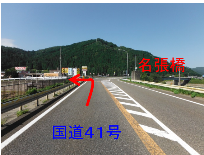
① 国道41号からの入口 (高山市街から向かって名張橋の手前を左折)