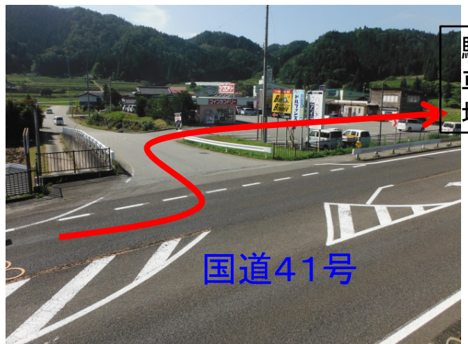
② 駐車場への入口 (矢印の先、奥の未舗装エリアが駐車場です)