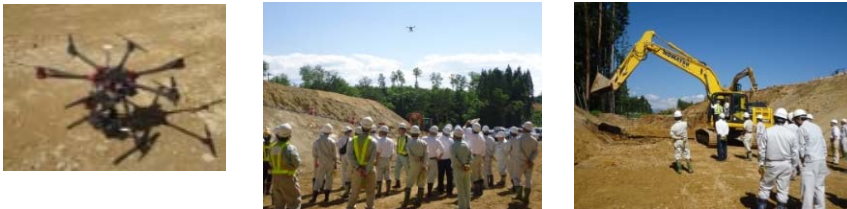
※上記写真はイメージです。

中部縦貫自動車道の事業説明と実際に行われている情報通信技術(ICT)を活用した工事について見学してもらいます。