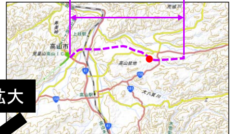
中部縦貫自動車道 高山I.C～丹生川I.C(仮称)