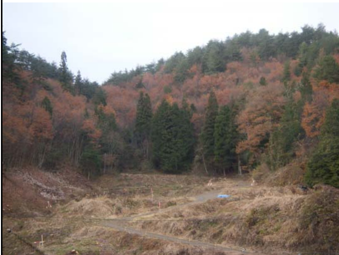
工事着手前の高山側坑口 (平成20年11月撮影)