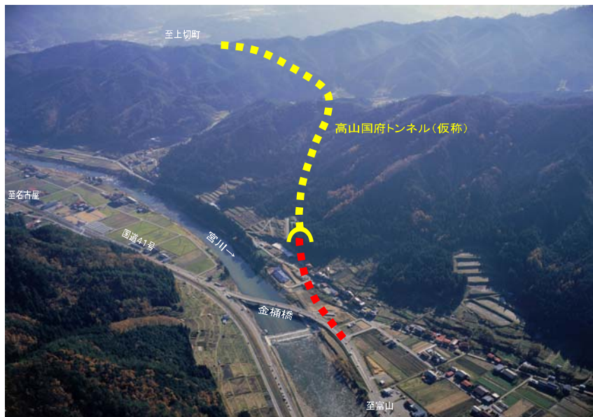
国道41号(国府町金桶)から高山国府トンネル(仮称)を望む