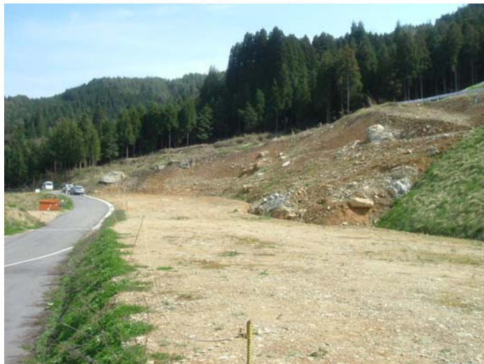
工事着手前の国府側坑口 (平成20年4月撮影)