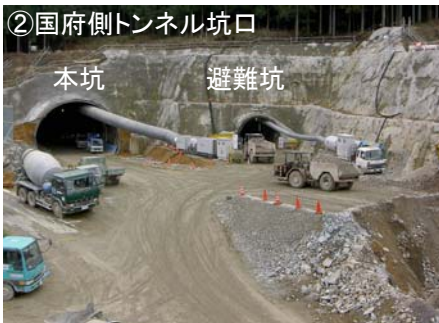
②国府側トンネル坑口

現在は比較的地山が安定しており、ダイナマイトを使用した発破作業による掘削方法が主体となっています。