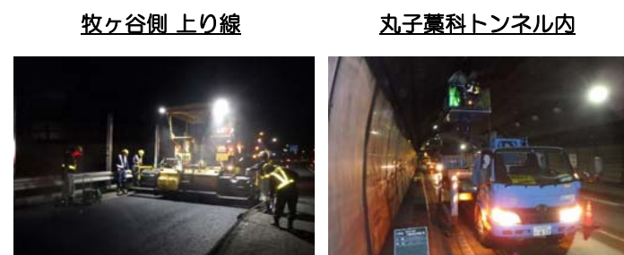
夜間の集中工事にて、舗装工事を行いました。