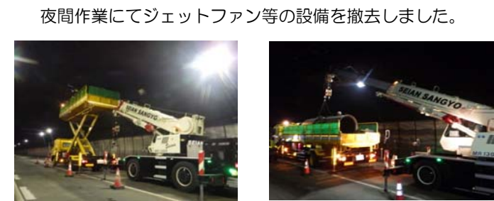
ジェットファン 撤去状況