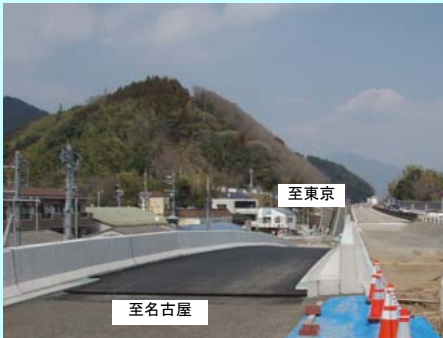
④ 羽鳥 IC (上り線オフランプ)