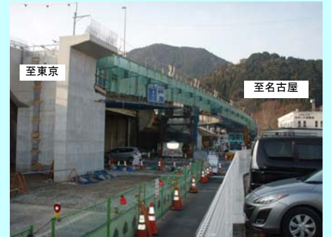
⑤ 牧ヶ谷 IC (上り線オンランプ)