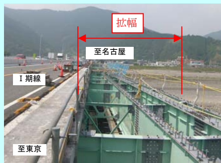
③ 藁科川橋 (拡幅工事)