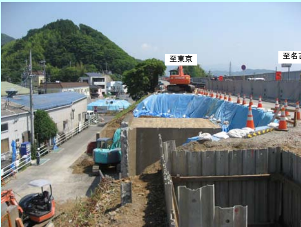
平成 25 年 5 月撮影