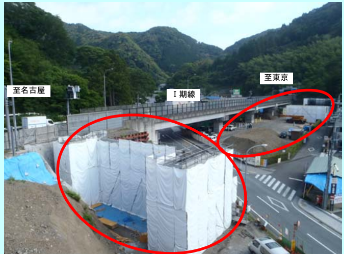
平成 25 年 5 月撮影