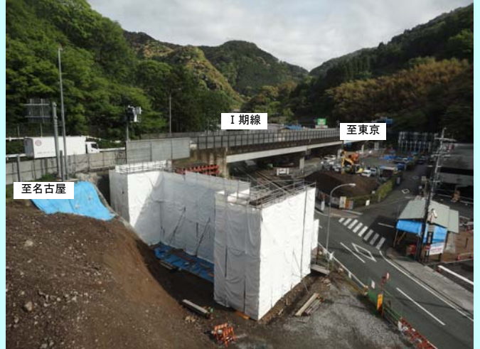
平成 25 年 4 月撮影