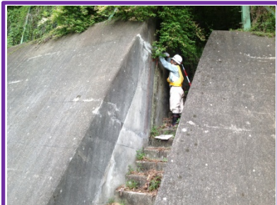
(参考) 過年度に実施した点検状況