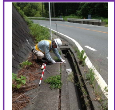
(参考) 過年度に実施した点検状況