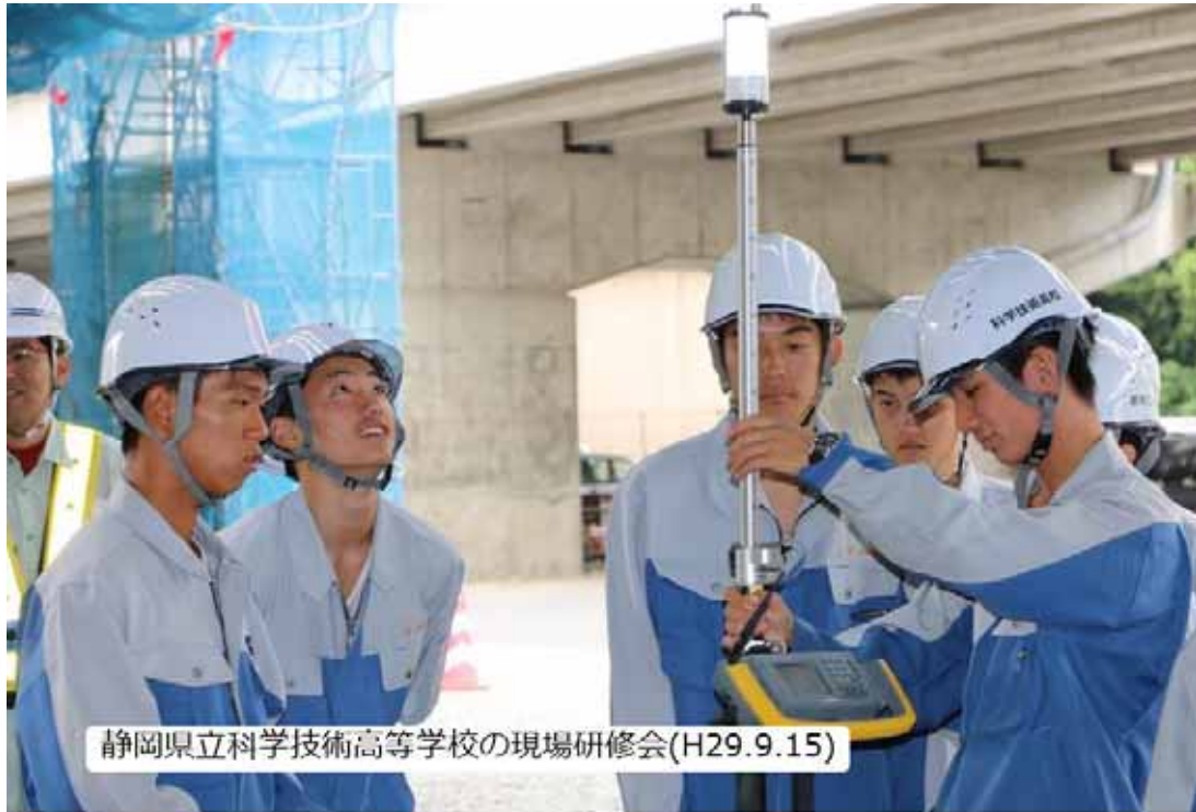
静岡県立科学技術高等学校の現場研修会(H29.9.15)