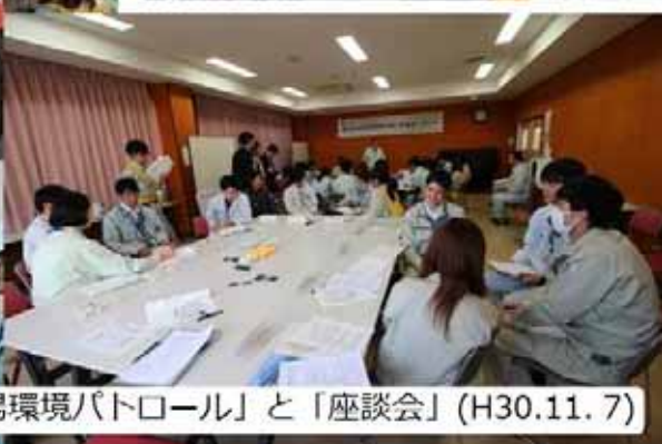
官民の若手・女性技術者による「現場環境パトロール」と「座談会」(H30.11.7)