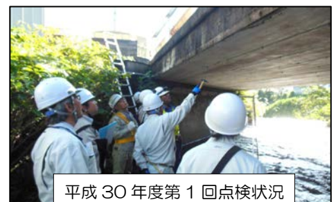
平成30年度第1回点検状況