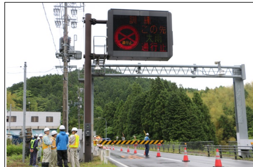
規制表示板の操作訓練