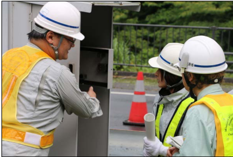
遮断機の操作盤の説明