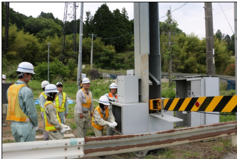
手動による遮断機の昇降