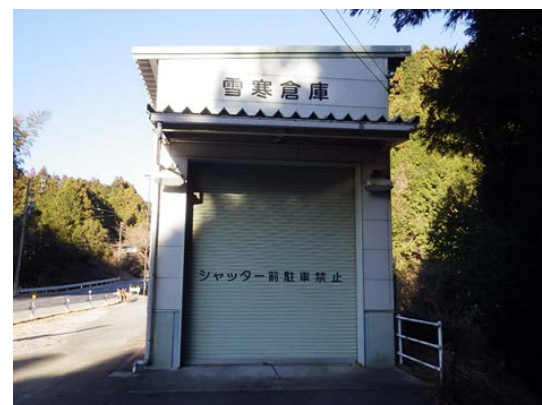
雪寒基地 (集合場所)

この位置図は地理院地図を使用しています。訓練場所には駐車スペースがありますので、ご利用ください