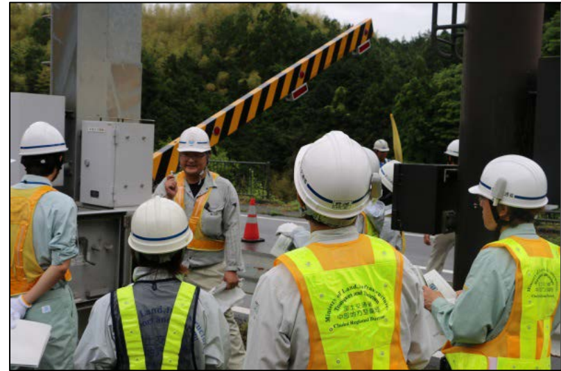
操作盤(自動)による遮断機の昇降