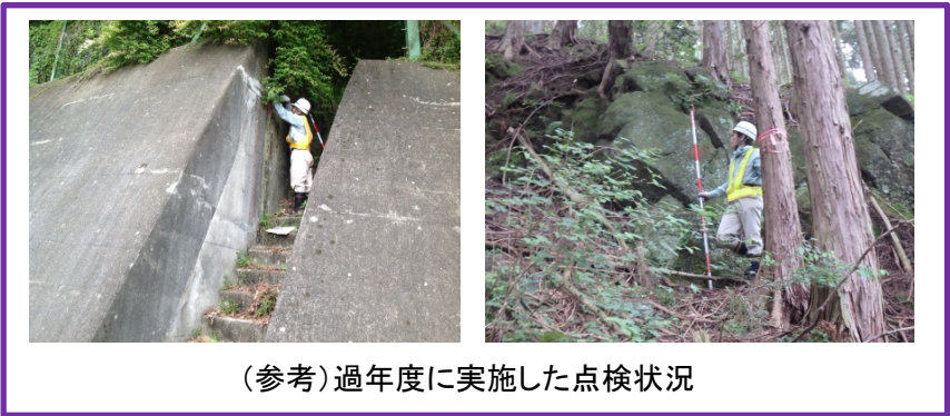
(参考) 過年度に実施した点検状況