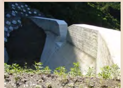
H30年9月末現在、施工状況(上流右岸側より)