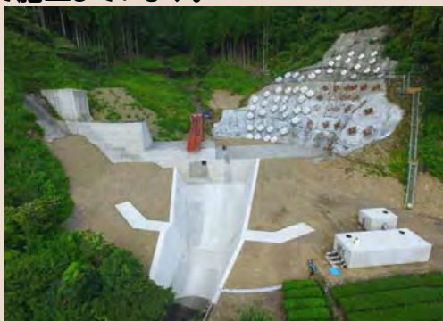
H25年度から施工中の杉の木沢砂防堰堤 (H29年9月末状況)

平成25年度から有東木地区で着手した杉の木沢砂防堰堤の継続工事です。平成30年度完成を目指して施工しています。