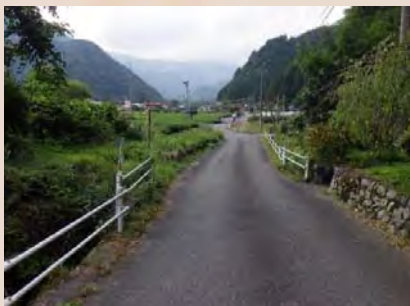
H29年10月末工事着手前状況

本工事はウラの沢砂防堰堤からの流水、土砂を安全に安倍川に流下させるための流路工工事です。昨年度に引き続き、既設の水路に替えて、流れる断面を大きく作り直しています。