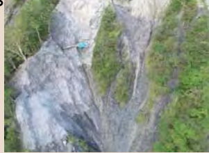
H30年9月末工事予定箇所状況