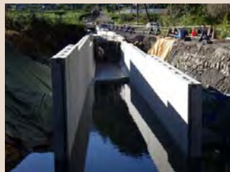
H30年9月末工事状況(起点より)