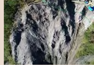
H30年9月末法面アンカー設置完了