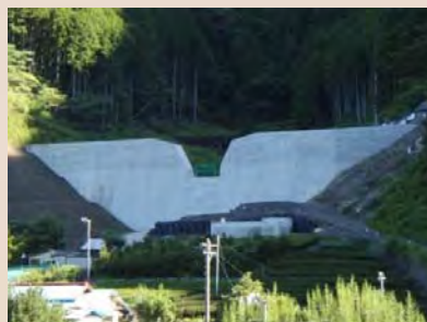
H30年9月末現在、施工状況(下流左岸側より)