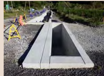
H30年9月末工事状況(終点より)