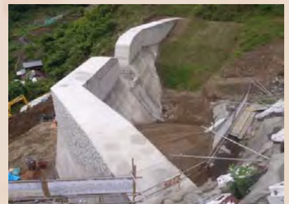
H30年5月末現在、施工状況(上流左岸側より)