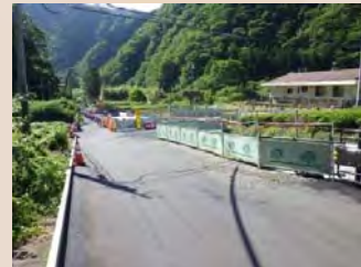
H30年5月末工事状況(終点より)