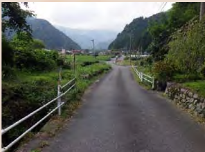
H29年10月末工事着手前状況

本工事はウラの沢砂防堰堤からの流水、土砂を安全に安倍川に流下させるための流路工工事です。昨年度に引き続き、既設の水路に替えて、流れる断面を大きく造り直しています。