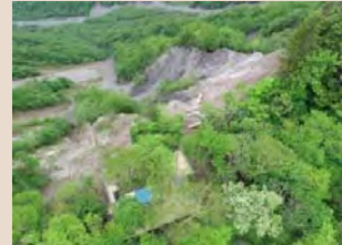
H30年5月末簡易索道設置