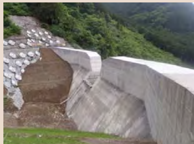
H30年5月末現在、施工状況(上流右岸側より)