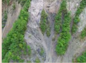
H30年5月末工事予定箇所状況