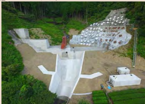
H25年度から施工中の杉の木沢砂防堰堤 (H29年9月末状況)

平成25年度から有東木地区で着手した杉の木沢砂防堰堤の継続工事です。平成30年完成を目指して施工しています。