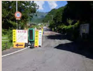
H30年5月末工事状況(起点より)