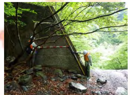
施設点検の様子(湯の島第2砂防堰堤)

地域の皆様におかれましては、砂防施設やお住まいの溪流周辺などでお気づきの点がありましたら梅ヶ島出張所までご連絡ください。