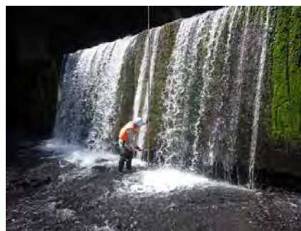
施設点検の様子(三郷川第1砂防堰堤)