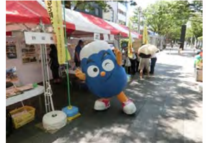
昨年の「砂防フェスティバル」の様子

土砂災害の怖さや、砂防事業の重要性を市民の皆様理解していただくため、6月10日(土)に静岡市葵区の青葉シンボルロードで「砂防フェスティバル」を開催します。この行事は、平成8年から「砂防フェスタしずおか」として、国土交通省静岡河川事務所、沼津河川国道事務所、富士砂防事務所、静岡県、静岡市、静岡地方気象台が共催して開催し、土砂災害防止に関する模型やパネルを展示します。皆様も是非お出かけ下さい。