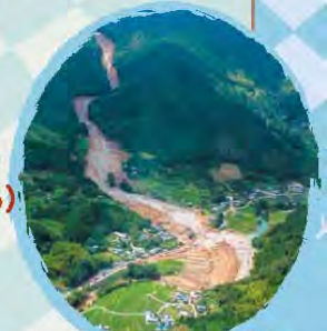
どしゃさいがいのようす