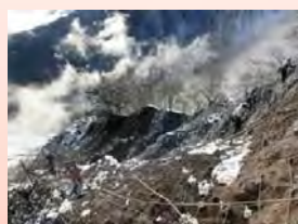
斜面上部から施工箇所を望む

寒さも厳しくなりますが、仮設の撤去が残っていますので最後まで無事故で工事を終わらせたいと思います。