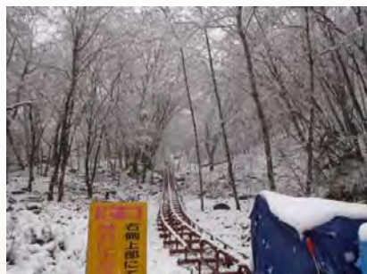
11月24日 午後(工事用モノレール)