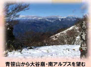
青笹山から大谷崩・南アルプスを望む