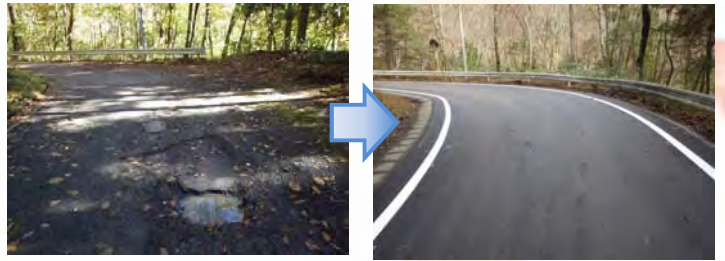
傷んだ舗装を補修(大谷工事用道路)

現在、工事進捗率は95%で11月26日に大谷工 事用道路の舗装、区画線の施工が完了しました。 長年の使用で舗装版が損傷しており、特に痛みの 激しい箇所を補修しました。工事用道路ですが、多 くの登山客や観光客が訪れます。皆さまが快適に 通行できるよう努めてまいります。施工時期は年間 を通じて交通量が落ちる冬場(紅葉シーズン終了 後)で降雪の前(11月下旬～12月上旬)となってい ます。ご協力、ご理解のほど宜しくお願い致します。