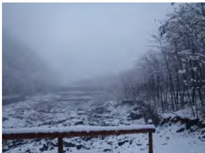
11月24日 午後(第11床堅工付)

東京で54年ぶりとなる11月の初雪が観測された24日、大谷崩にも初雪が降りました。現場事務所周辺 で約10cmの積雪があり、市街から約1時間で静岡とは思えない別世界が広がっていました。