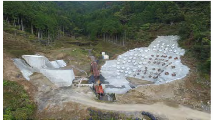
左岸側の法面対策工事が完了しました。

(株) 白鳥建設 大口です。 11月7日に無事工事が終わり、15日に完成を迎えました。今回の工事は左岸側の法面工(グラウンドアンカー49箇所)と堰堤本体のコンクリート打設(343m 3 )です。 法面工は大変苦労しましたが、色々と勉強になり自分自身のスキルアップに繋がったと思います。これからも工事は続きますが、日々勉強し、がんばっていきたいと思います。