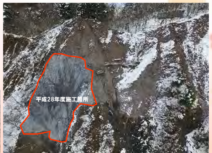
正面から施工箇所を望む