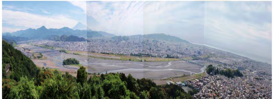
丸山花木園から望む安倍川の様子

安倍川には、土砂災害の危険や洪水の時に起こる流れの偏りのほか、海岸侵食など、様々な課題があり、安倍川源流から海岸まで連携した対応が必要です。こうした課題を解消するため、全国に先駆けて平成25年7月に「安倍川総合土砂管理計画」を策定しました。市街を一望する丸山花木園を見学場所に、本計画についてご案内いたします。