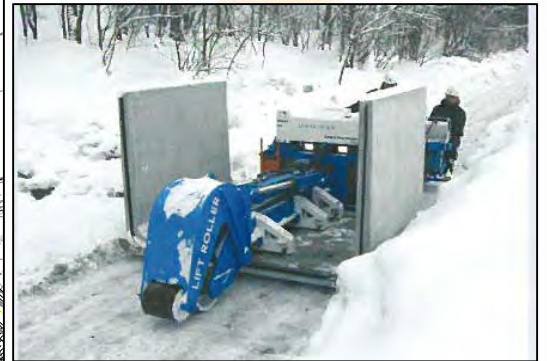
リフトローラーでの水路運搬設置状況事例

本工事は梅ヶ島新田地区において継続事業として行われている流路工工事です。今年度の主要工種はU型水路工となっており、延長L=68mを布設予定です。