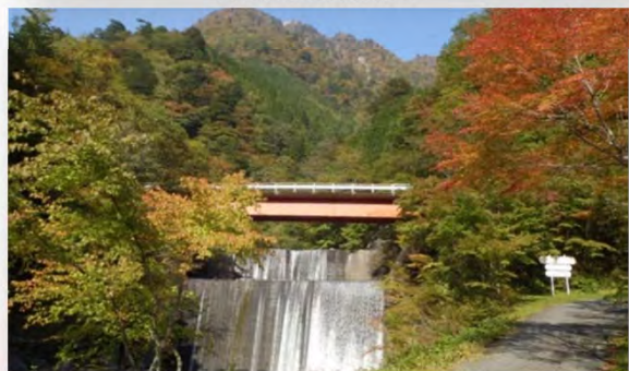
湯の島砂防堰堤と紅葉