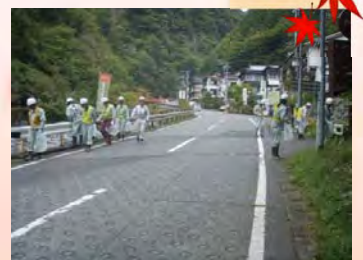
ゴミのポイ捨てはやめましょう!