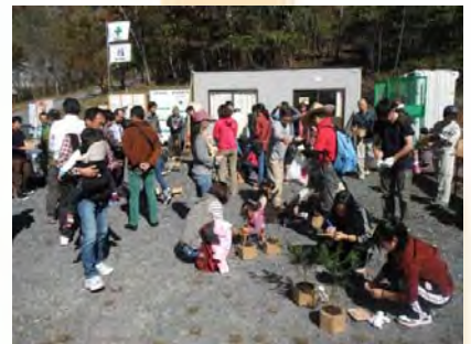
紙製ポットを使って苗木づくり

10月25日、紅く色づいた大谷崩れで本年度も静岡西・北のロータリークラブの会員の皆さん総勢約60名が植樹を行いました。静岡西ロータリークラブは本年6月、長年の植樹活動が認められ、土砂災害防止功労者として全国表彰を受賞されています。同会では「植樹活動を通じて自然とふれあい、いのちの大切さを学ぶとともに、山を守ることが水や海を守ることに繋がる」として会員の他、市内の高校生や市内在住の留学生らにも呼びかけて活動を行っています。