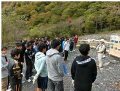
大谷崩れでの山腹工事概要の説明に耳を傾ける