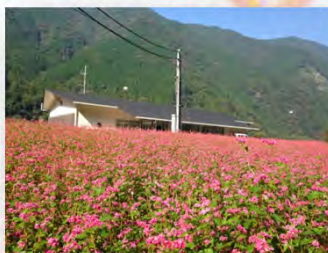
大河内地区センター脇では紅そばの花が満開です。

県道29号線を市街地方面に向かう途中の珠数窪トンネル入口に描かれたイワシャジン。秋の梅ヶ島を代表する野草で今が見頃です。溪谷の湿り気のある岸壁などに自生します。自生地によって草丈や姿に若干の違いがあり、産地の名前を冠して区別されています。梅ヶ島産のものは「ウメガシマイワシャジン」と呼ばれています。