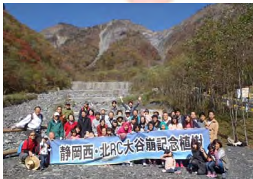
当日は雲一つない秋晴れでした