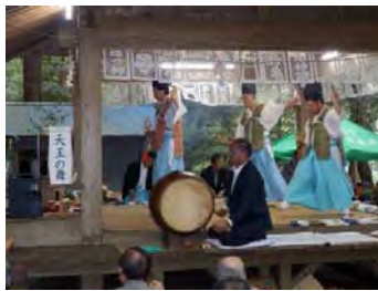
伝承されている舞は16演目