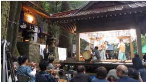
太鼓と笛の神楽囃子

大河内学区有東木の神楽は、平成14年に指定された静岡市の無形民俗文化財で、4月上旬と10月第2土曜日の春秋2回、白髭神社の祭礼で奉納されます。幕末にはすでに行われていたようで、現在伝承されている舞は「松竹梅の舞」、「恵比寿の舞」、「火の舞」など16演目があり、辺りが暗くなった夕方6時頃には灯笼の灯りと舞人が手にした採り物の炎のみが照らす「火の舞」の奉納でクライマックスを迎えます。