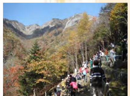
深まる紅葉の中、苗木を植えます