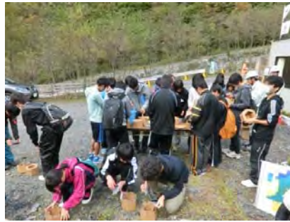
紙製のポットを組立