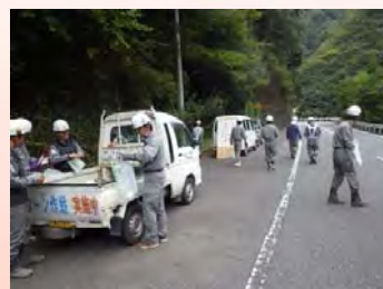
クリーン作戦実施中!

10月10日、梅ヶ島学区の青少年健全育成大会とクリーン作戦が行われ、出張所安全協議会の会員が参加しました。クリーン作戦では、地域の大動脈である県道を3班に分かれて清掃活動を実施し、大型のゴミ袋で10袋を集めました。清掃後、PTAの方々による豚汁のサービスで舌鼓を打ち、疲れも吹き飛びました。(株)新村組 豊嶋