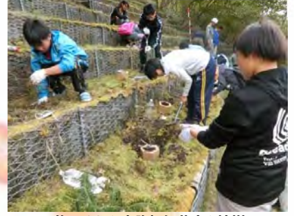
施工された山腹柵に苗木を植樹

10月25日、紅く色づいた大谷崩れで本年度も静岡西・北のロータリークラブの会員の皆さん総勢約60名が植樹を行いました。静岡西ロータリークラブは本年6月、長年の植樹活動が認められ、土砂災害防止功労者として全国表彰を受賞されています。同会では「植樹活動を通じて自然とふれあい、いのちの大切さを学ぶとともに、山を守ることが水や海を守ることに繋がる」として会員の他、市内の高校生や市内在住の留学生らにも呼びかけて活動を行っています。