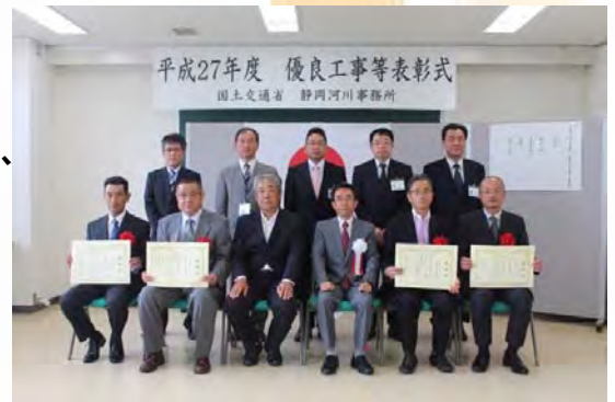
表彰後の記念撮影