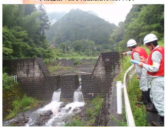
砂防施設の臨時点検状況(7月4日)