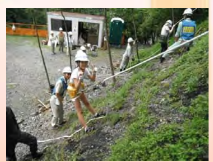
斜面を作業<模擬体験>