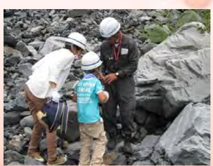
見つかるかな?<化石探し>