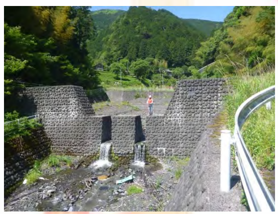
砂防施設の出水期前点検状況(5月)

地域の皆様におかれましても、砂防施設、お住まいの溪流周辺などでお気づきの点がありましたら梅ヶ島出張所までご連絡下さい。