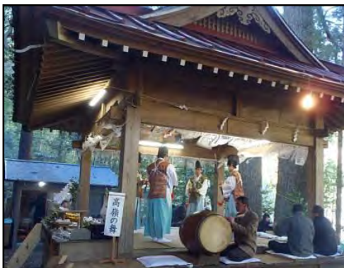
中学生による「高嶺の舞」

市の無形民俗文化財に指定されているこの神楽は、有東木芸能保存会の指導のもと伝承され、地域の方々とともに中学生も舞っている姿を拝見し、次の世代に確実に引き継がれていると感じました。また礼儀作法も含め厳しい練習を日々繰り返している様子も伝わってきました。なお、改装された「真富士の里」の掲示板にも大河内中学校の文化発表会での神楽演舞の様子が展示されています。