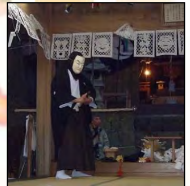
威風堂々とした「侍の舞」