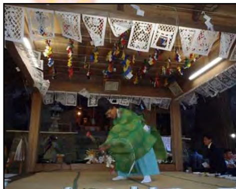
「弓の舞」放った矢は魔除に