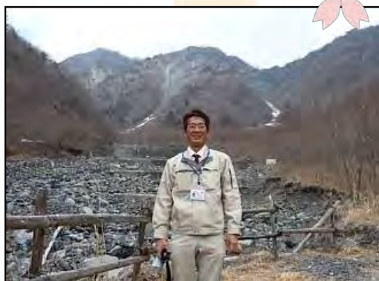
残雪の大谷崩にて(4月11日) (モノレールが落石により被災していました)

先日初めて大河内、梅ヶ島、大谷崩を訪れたのですが、季節から桜と梅が満開ですばらしい光景でした。これからの2年間、この地域がはぐくんでいる、このような多くの「雄大な自然」に出会えることを楽しみながら、「厳しい自然」に立ち向かうべく、事業推進に向かって邁進して参りたいと考えております。