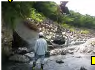
(写真2)袋詰玉石を空洞部に (写真3)重機にて巨石を並べる (写真4)完成状況(全景)

施工は、袋詰玉石を空洞部に詰め(写真2)、その前面に重機にて巨石を並べて保護しました(写真3)。