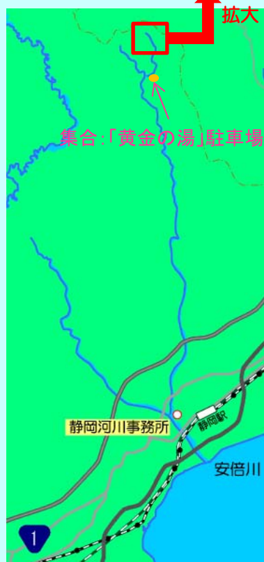
湯の島第2砂防堰堤