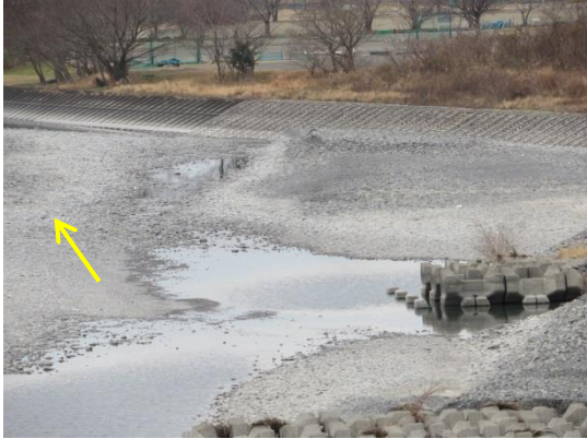
安西橋下流(約7.0km)(2月14日)