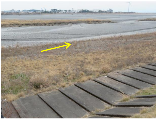
南安倍川橋下流(約0.8km)(2月14日)