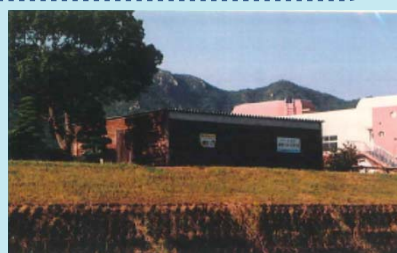
市民団体による活動拠点の整備事例（佐波川）

※ 河川管理者から河川管理施設の維持、除草等の委託を受けることも可能となります。委託先については、公募等の適正な手続きを経て選定を行う予定です。