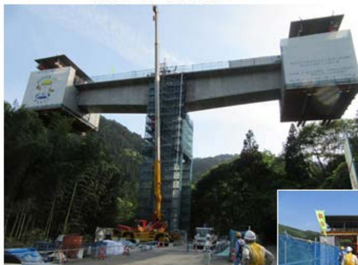
工事名：平成28年度 新丸山ダム并尻八百津複新小和沢橋PC上部工事 請負者：株D-Iインフラ建設 2径間連続ラーメンPC箱桁橋 橋長 L=240.0m