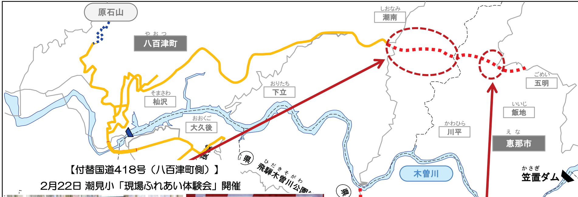
【付替国道418号（八百津町側）】