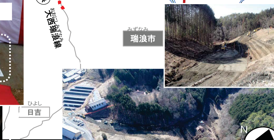
【付替国道418号（恵那市側）】 工事用道路 土工着手