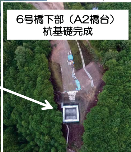
6号橋下部（A2橋台） 杭基礎完成