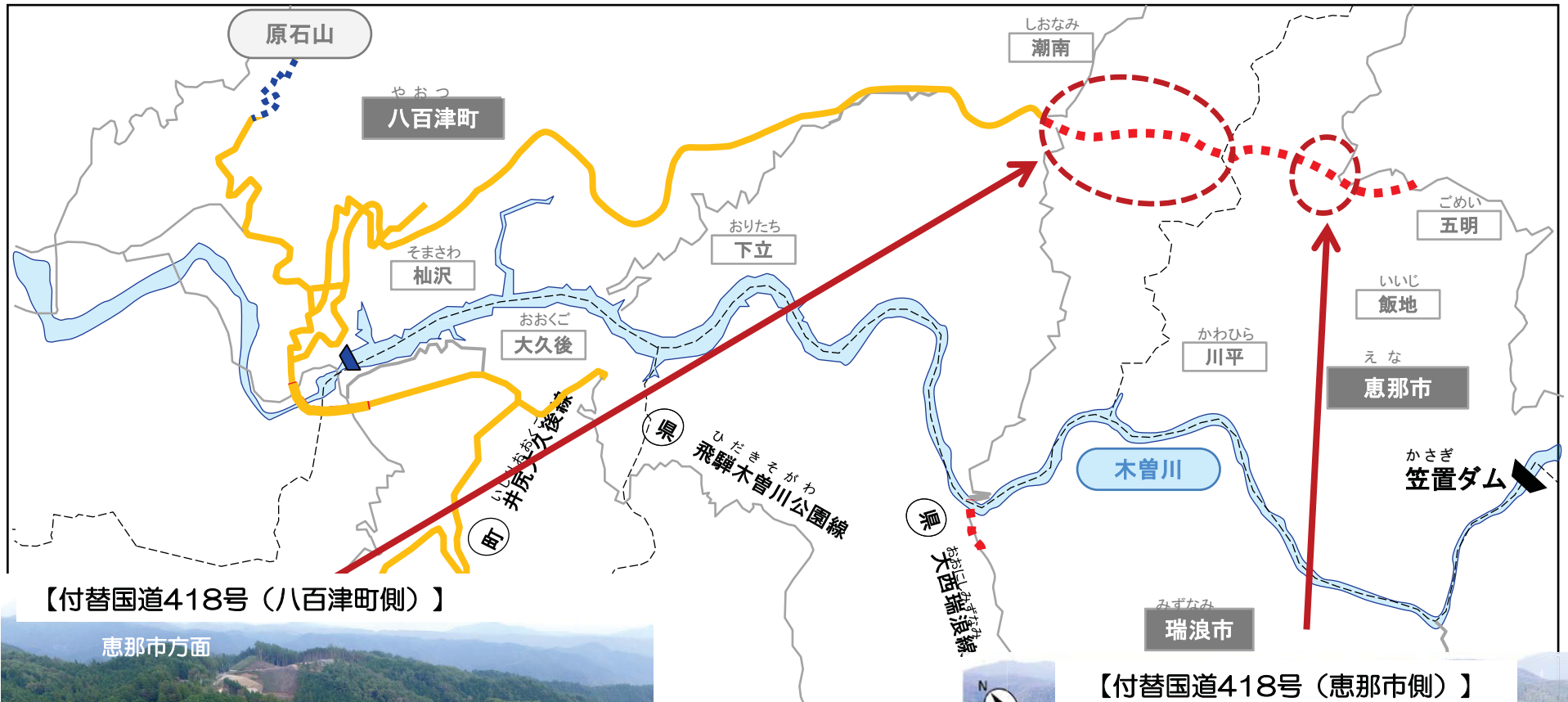
【付替国道418号（八百津町側）】