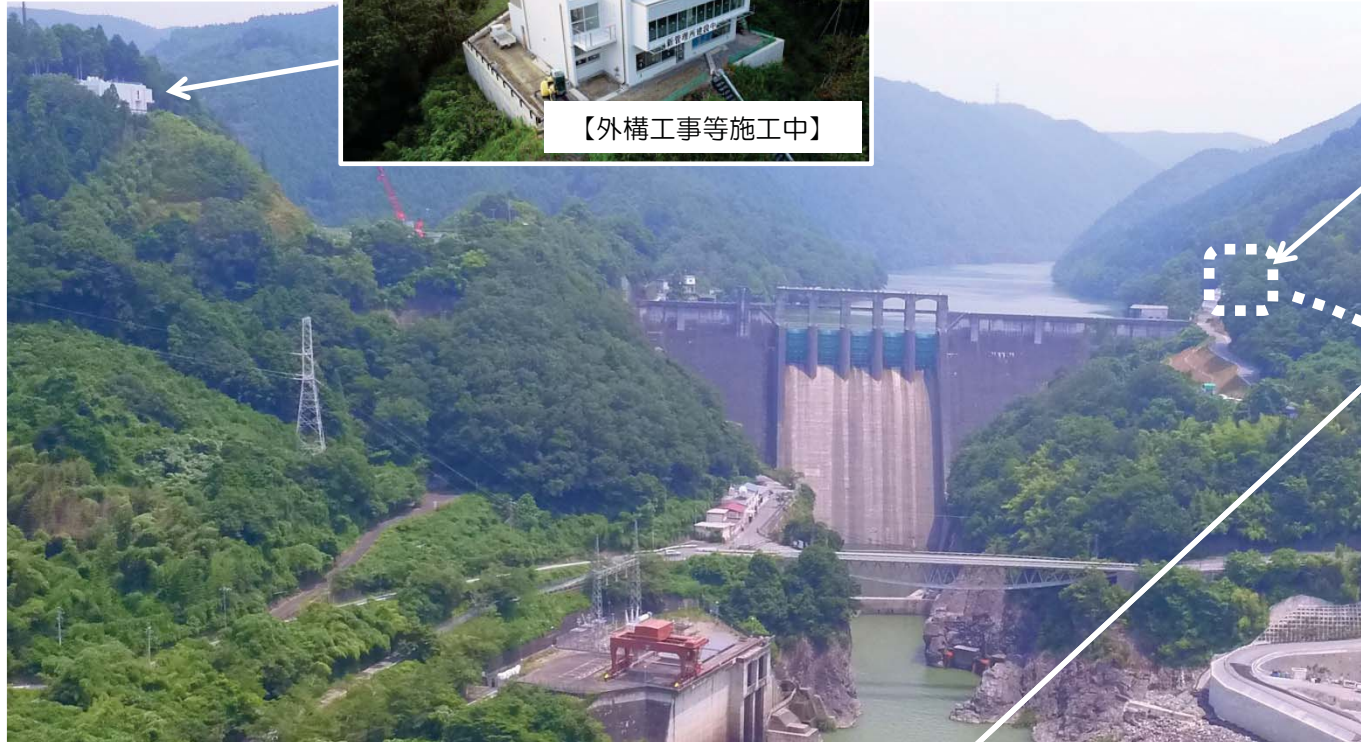
転流工事進捗状況 (平成30年7月末)