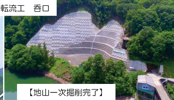
転流工事進捗状況 (平成30年6月末)