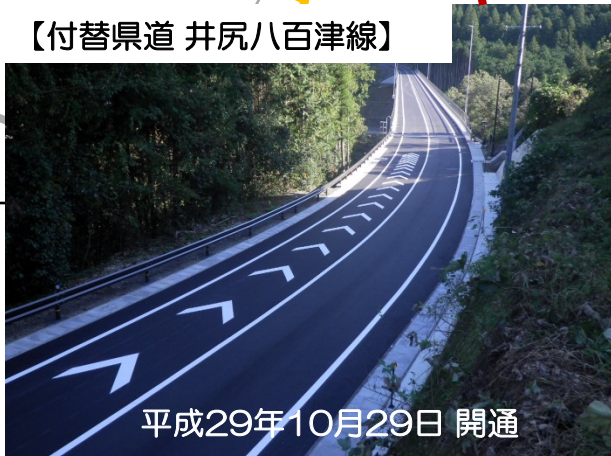
【付替県道 井尻八百津線】