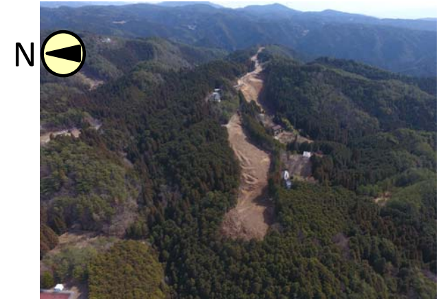
平成28年度末の状況