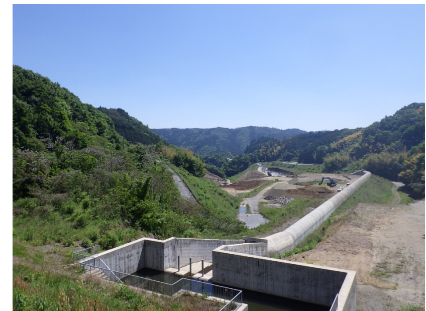
口杣沢残土受入地 5月末

平成28年度 新丸山ダム転流工事 業者名:前田建設工業(株) 工事期間:平成28年9月17日～平成31年3月8日