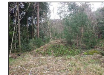
着工前(新小和沢橋A2橋台予定箇所)

※(仮称)第二小和沢橋(P1橋脚、A2橋台)は、8月頃から着手予定をしております。