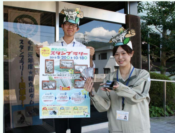
抽選で当たる水圧鉄管のかけらと丸山ダムレトロカード