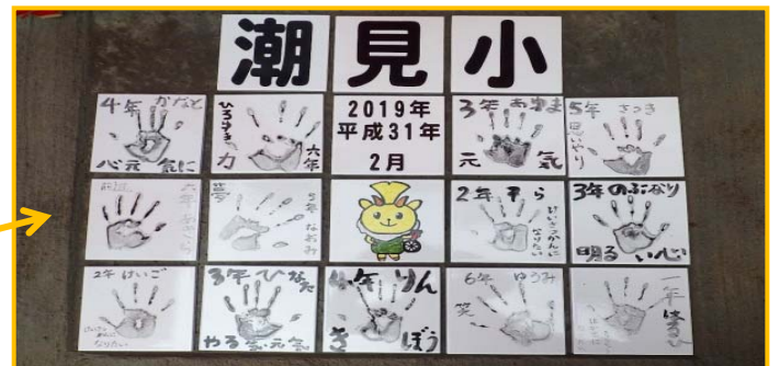
橋の一部に設置された手形タイル