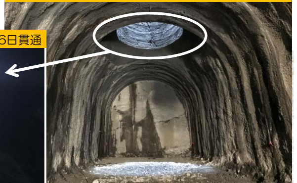
2019年(平成31年)1月26日貫通