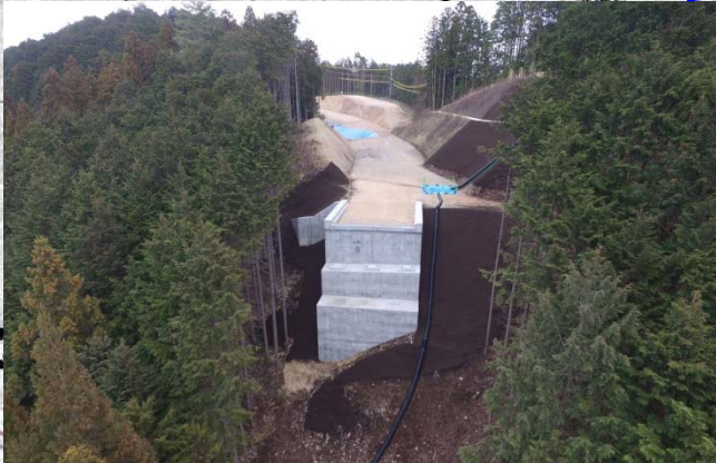
八百津町潮見 付替国道418号（6号橋）A2橋台完成