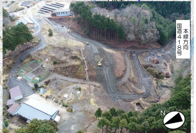
恵那市飯地町 付替国道418号（工事用道路）土工着手