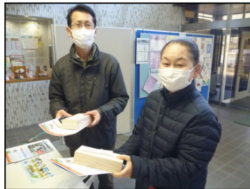
3つの記念石を集めた方には箱も進呈