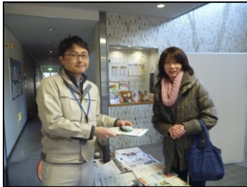
記念石の交換の様子