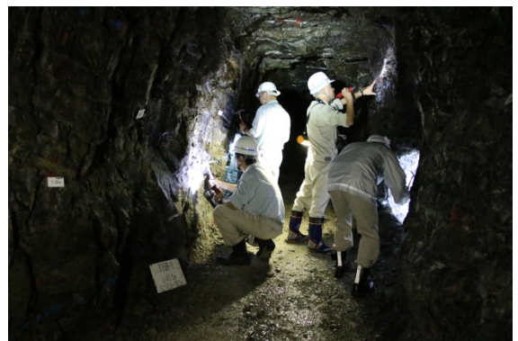
試掘横坑での壁面観察

今後のダム建設工事に向け、より安全で経済的なダム設計のために必要となる技術的助言を得ることができました。