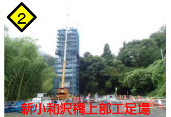
新小和沢橋上部工足場