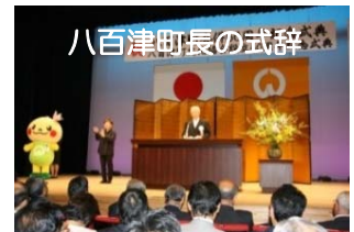
八百津町長の式辞