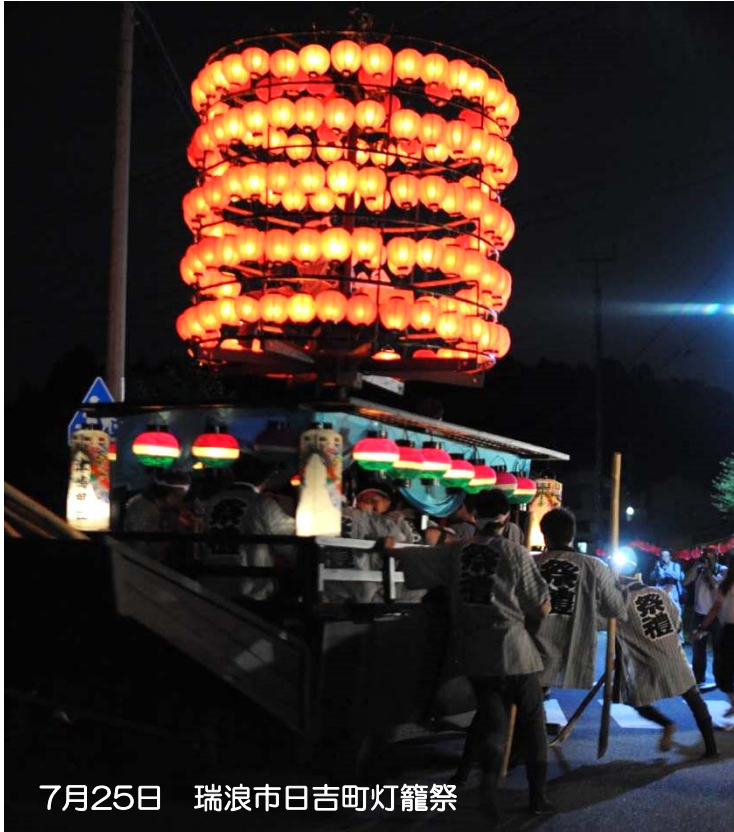
7月25日 瑞浪市日吉町灯籠祭

編集・発行 国土交通省中部地方整備局 新丸山ダム工事事務所 〒505-0301 岐阜県加茂郡八百津町八百津3351 TEL0574-43-2780 FAX0574-43-3921 ホームページアドレス http://www.cbr.mlit.go.jp/shinmaru/ メールアドレス shinmaru@cbr.mlit.go.jp 平成27年8月21日発行