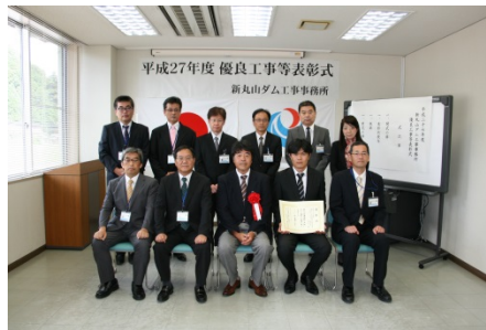
大日本コンサルタント(株) 中部支社