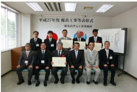
(株)栗山組、豊進鉄筋(株) (株)平田組、(有)石底工務店