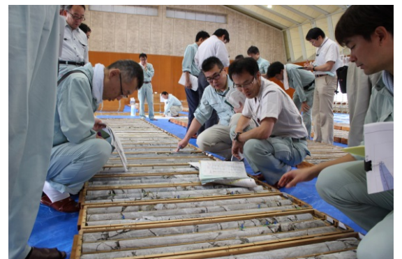
高品質ボーリングコアの観察