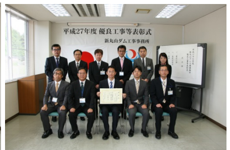
基礎地盤コンサルタンツ(株) 中部支社