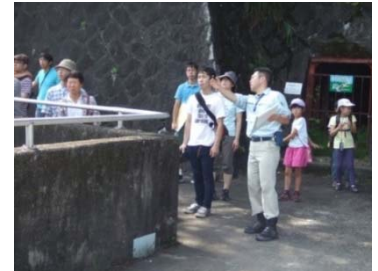
新丸山ダムの説明を行う 当事務所職員

行程は、可児駅集合の後、小里川ダム・阿木川ダム・丸山ダムの順で見学が行われ、日頃、ダムの管理を行っている職員自らが案内や説明を行う、手作り感満載のツアーとなりました。