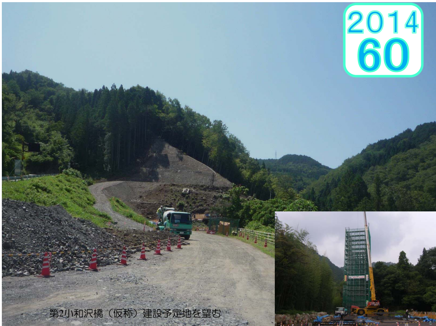
第2小和沢橋（仮称）建設予定地を望む