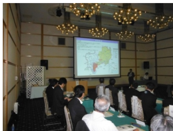
三輪事務所長のH26年度事業概要等説明