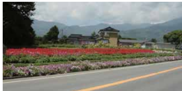
地域住民により美しく植栽された沿道