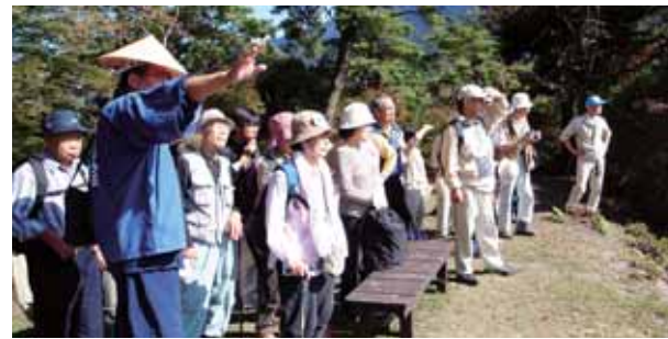
旧街道ウォーキング・イベントによるガイド